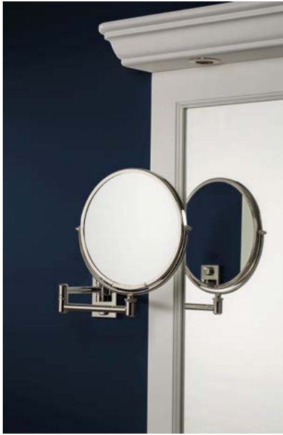
MIROIRS DE BEAUTÉ BEAUTY MIRRORS